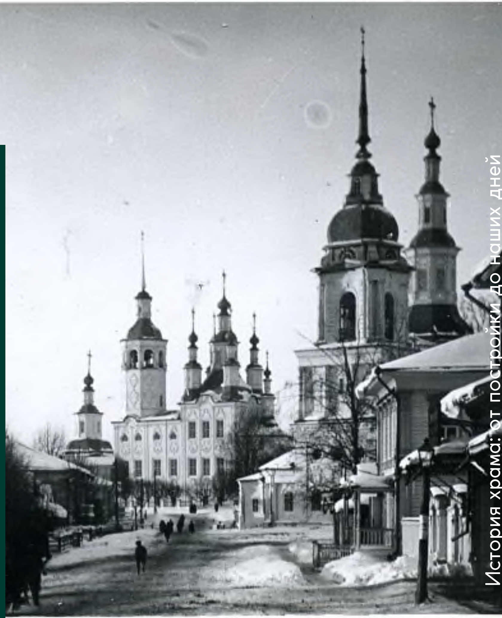
История храма: от постройки до наших дней