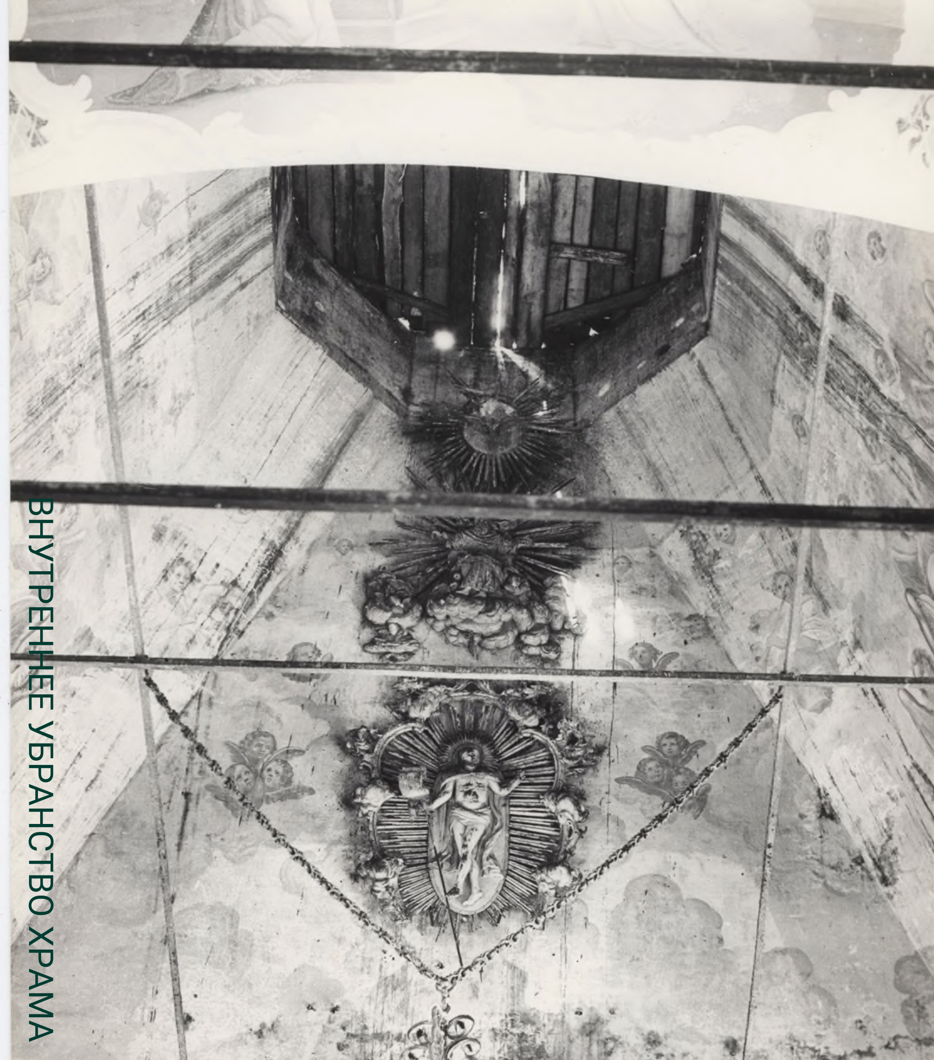
ВНУТРЕННЕЕ УБРАНСТВО ХРАМА